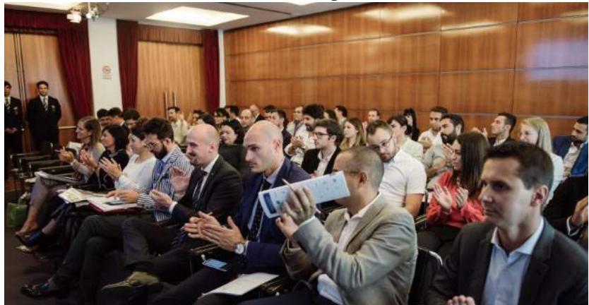
Un momento del seminario