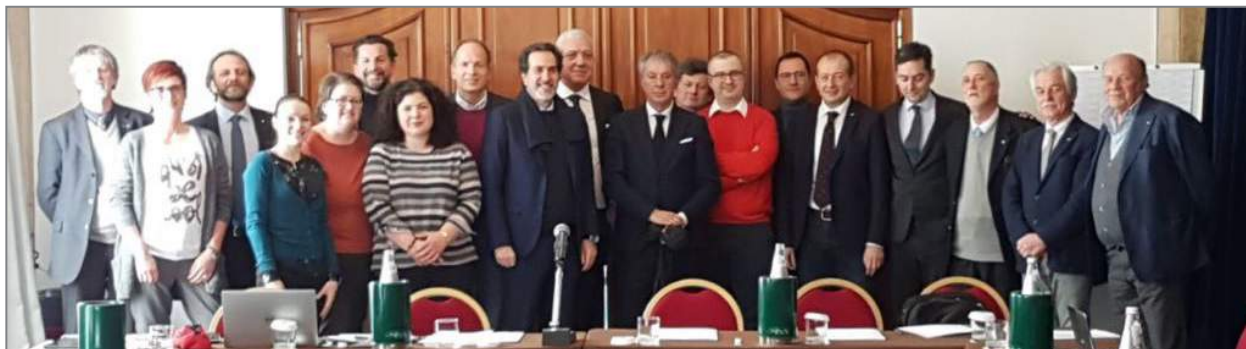
nella foto: alcuni dei partecipanti all'Assemblea di Federalberghi Extra

ha eletto gli organi sociali per il biennio 2018 - 2019.